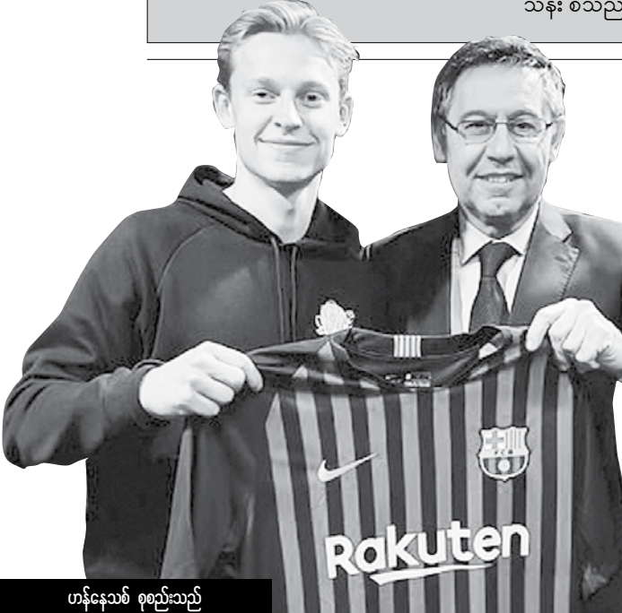
ဟန်နေသစ် စုစည်းသည်

အခြားတစ်ဖက်တွင် ဘာစီလိုနာအသင်း၏ တိုက်စစ်မှူး မက်ဆီကလည်း အသင်းနှင့် ယူရို ၇၅ သန်းတန် စာချုပ်သစ်တစ်ရပ်ကို ချုပ်ဆိုရန် ဆန္ဒရှိနေကြောင်း ထုတ်ဖော်ပြောကြားလိုက်သည်။ ယင်းကိစ္စနှင့်ပတ်သက်၍ ဘာစီလိုနာအသင်းမှ တာဝန်ရှိသူများအနေဖြင့် အချိန်တိုအတွင်းတွင် ဆုံးဖြတ်ချက်တစ်ခုခု ချမှတ်ရမည်ဖြစ်သည်။