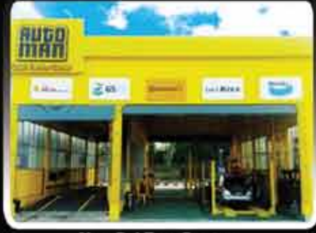
Nay Pyi Taw Center