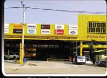
Thitsar Street Center